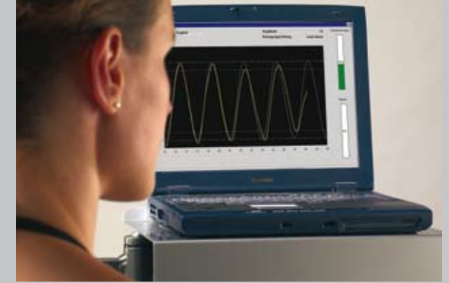
Motivation durch Vorgabekurven

WISSENSWERTES Die Behandlungsmethode tergumed®* ist ein medizinisches Rückentrainingsprogramm, das den Rückenschmerz durch aktive Trainingstherapie behandelt. Wissenschaftliche Untersuchungen haben gezeigt, dass die Muskulatur von Rückenschmerzpatienten erhebliche Defizite und Dysbalancen aufweist. Um diesen entgegenzuwirken, verknüpft tergumed® die Behandlungsformen Muskelaufbautraining und Ausdauertraining. Diese Therapiemethode hat sich in Studien mit Rückenschmerzpatienten als überaus erfolgreich erwiesen.